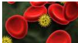
Virus du Sida et Hématies

Toutefois, la Société des Amis de Pasteur a maintenu le lien avec les écoles impliquées en envoyant aux professeurs des documents dont vous avez ci-dessous un échantillon.